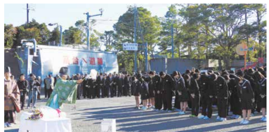
広小、耐久中の児童、生徒が参加して行われた津浪祭