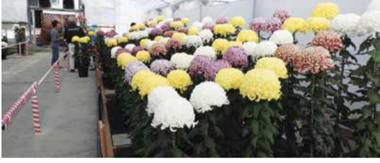
日本一を決める国華園の菊花展