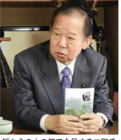
稲むらの火の館で会える二階氏