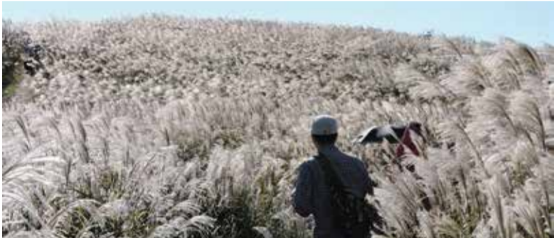
生石高原のススキの草原は関西随一。これから黄金色に輝き出す