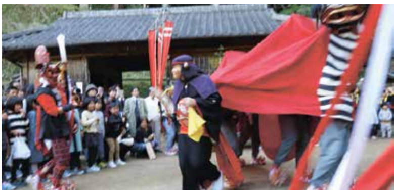
4人立ちの獅子舞の中からオカメさん登場(寒川祭)