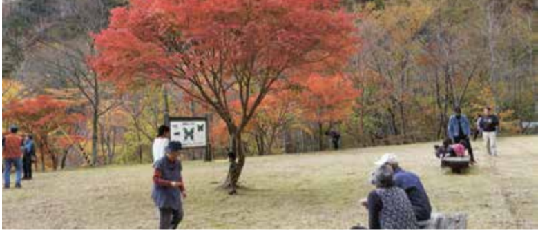
龍神スカイラインは紅葉まっ盛り