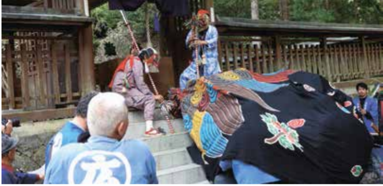
龍神4神社で秋祭りにぎわう。皆瀬神社の獅子せせり