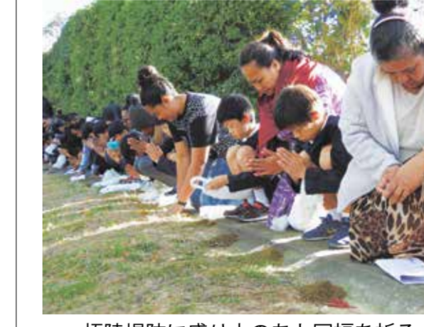
梧陵堤防に盛り土のあと冥福を祈る