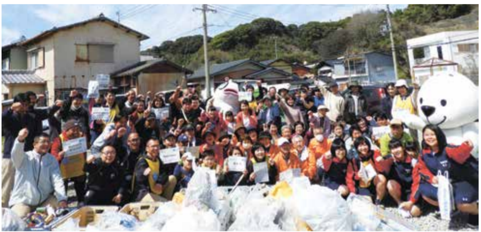
拾ったゴミ袋を前に参加者全員で記念撮影

湯浅町で「スポGOMI」大会が開催された。優勝したのは環境係チーム。大会は、町民のゴミ拾いを促進し、環境意識を高めることを目的として行われた。 大会は、湯浅町で「スポGOMI」大会が開催された。優勝したのは環境係チーム。大会は、町民のゴミ拾いを促進し、環境意識を高めることを目的として行われた。 大会は、湯浅町で「スポGOMI」大会が開催された。優勝したのは環境係チーム。大会は、町民のゴミ拾いを促進し、環境意識を高めることを目的として行われた。