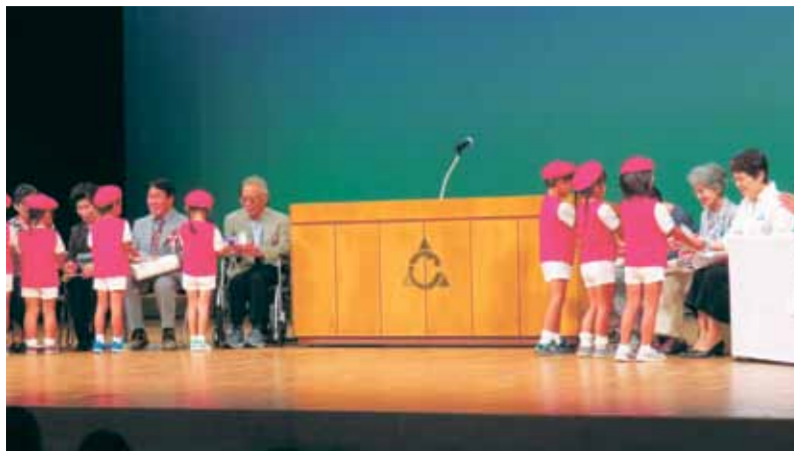
プレゼントを手渡す園児ら

平成29年度の御坊市敬老会は18日、御坊市民文化会館で開かれた。お年寄りに優しく接した模範市民らが表彰を受け、園児がダンスやピアノなどで喜ぶプレゼントをした。