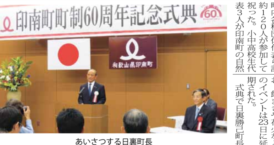
あいさつする日裏町長

今年度は塩屋と名田地区で策定する予定。市防災対策課は、今年度2、3年かけて御坊市内全域での策定を目指すという。