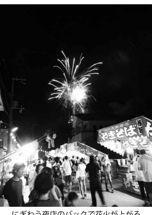
にぎわう夜店のバックで花火が上がる

7月22日、湯浅広港周辺で開催された「湯浅まつり」(同実行委員会主催)の花火大会は、有田・日高地方で一番早い大きな花火大会とあって、付近市町村から大勢の人出でにぎわった。町の人口は2倍に膨れ上がった。海岸通りから港保育