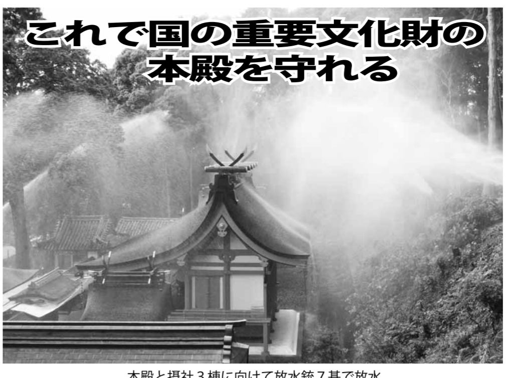
本殿と摂社3棟に向けて放水銃7基で放水

安政南海地震(1854年)で、津波から村人を救った浜口橋陵が避難先として導いた「福むら火」の故事で知られる廣八幡神社。防災工事の完成を待たず、7月21日、本宮(平公宮)は、平成26年度から28年まで3年をかけた、40年ぶりとなる大改修を終了した。この形で後世に伝えたいと、平成の大改修を昨年引渡したお披露目が行われた。